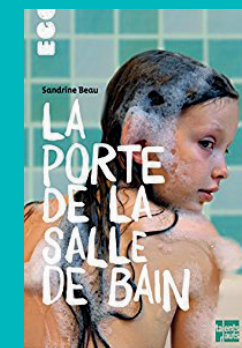
« La porte de la salle de bain » (Sandrine Beau / Editions Talents Hauts)