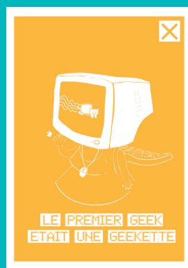
« Les découvreuses anonymes » (Wax Sciences / Animafac)

Contenu : 20 bâches plastifiées souples 80 x 67 cm + livret de montage