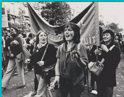
« Lutttes des femmes, progrès pour tous » (Femmes ici et ailleurs)