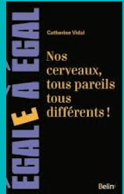
« Nos cerveaux, tous pareils, tous différents » (Collection « Egale à égal »/Editions Belin)