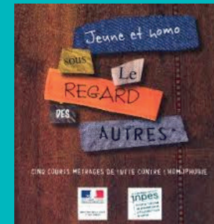
« Jeune et homos sous le regard des autres » (INPES)