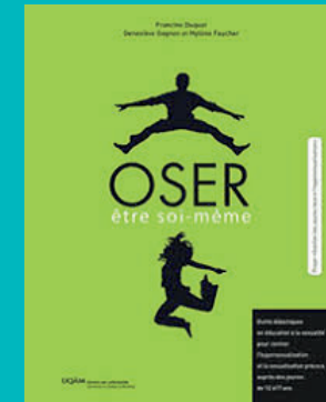
« Oser être soi-même : Outiller les jeunes face à l'hypersexualisation » (UQAM / Université du Québec à Montréal)