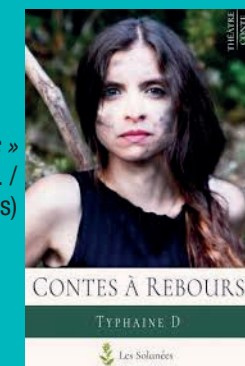
« Contes à rebours » (Typhaine D. / Editions Les Solanées)