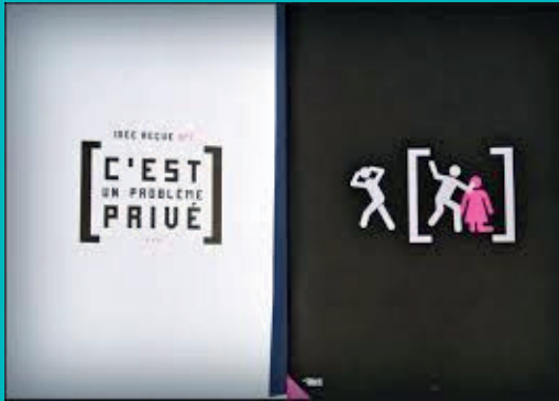
« Déconstruire les idées reçues sur les violences faites aux femmes » (Association Nationale des Elu-e-s Contre les Violences faites aux Femmes)

Contenu : 24 panneaux plastifiés 40x40 cm