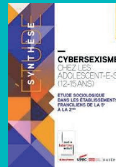
« Cybersexisme chez les adolescent.e.s (12-15 ans) »