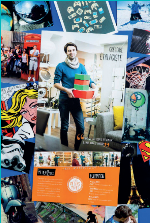
« Tous les métiers sont mixtes » (Femmes ici et ailleurs / Randstad)

Contenu : 2 grands panneaux 3m x 2,30 m et 2,50m x 2,30m et 1 vidéo de 5 minutes