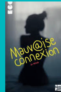
« Mauvaise connexion » (Talents Hauts)