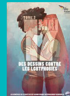
« Des dessins contre les LGBT phobies » (SOS Homophobie / Editions Des ailes sur un tracteur)