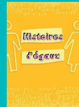
« Histoires d'égaux » (Du côté des Femmes / le Onde / Solidarité Femmes)