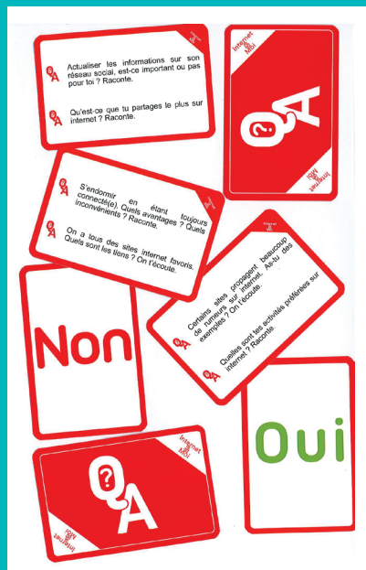
« Internet et moi : Questions d'usage(s) ? » (Editions Valorémis)