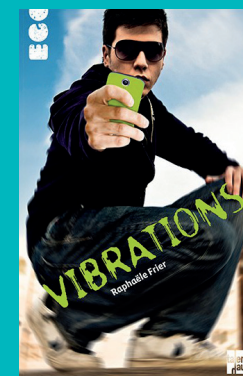
« Vibrations » (Talents Hauts)