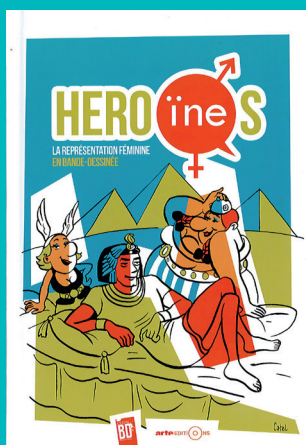
« Héro(ine)s : la représentation féminine en bande dessinée » (Lyon BD Festival)