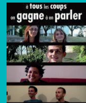
« À tous les coups, on gagne à en parler » (Contact HG)