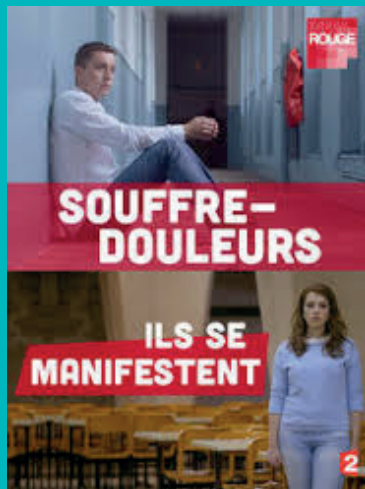
« Souffre-douleur : ils se manifestent » (A. Rawlins-Gaston et L. Follea)