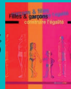
« Filles & Garçons, construire l'égalité » (Mouvement du Nid)