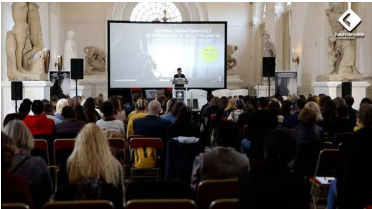
Source : Le département à l'initiative d'une semaine de prévention et de lutte contre la prostitution des jeunes, Départements des Hauts-de-Seine, 2021-11, 1 min 54 sec, en ligne : Accéder à la ressource