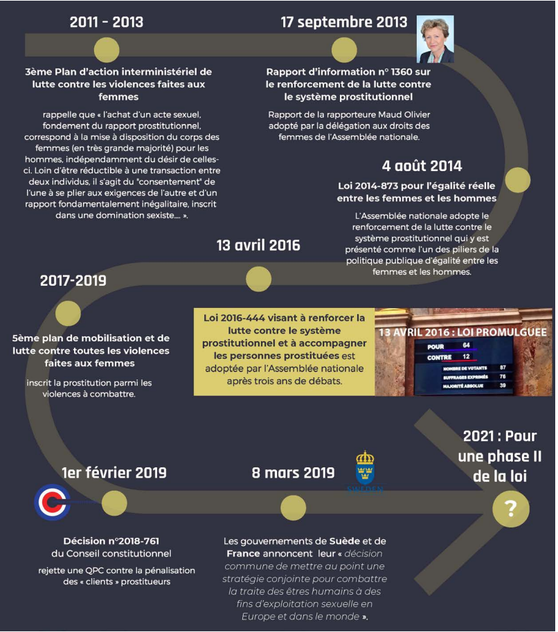
Source : La situation de la prostitution en France. Analyse des associations de terrain sur l'impact de la loi du 13 avril 2016 et recommandations pour une phase II, FACT-S, 2021-02, 150 p. Accéder à la ressource